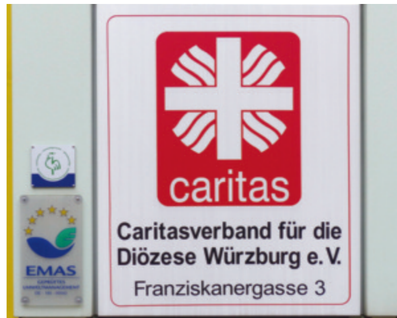
Seit 2003 ist das Caritashaus in der Würzburger Franziskanergasse EMAS-zertifiziert. Seit Februar 2017 trägt es auch das kircheninterne Umweltmanagement-Zertifikat „Grüner Gockel“.

„EMAS“, eine Abkürzung von „Eco-Management and Audit Scheme“, ist ein international anerkanntes und von der Europäischen Union gefördertes Umweltmanagement-System. Der „Grüne Gockel“ ist ein ökologisches Bewertungsprogramm für Kirchengemeinden und kirchliche Einrichtungen. Ziel beider Siegel ist es, den